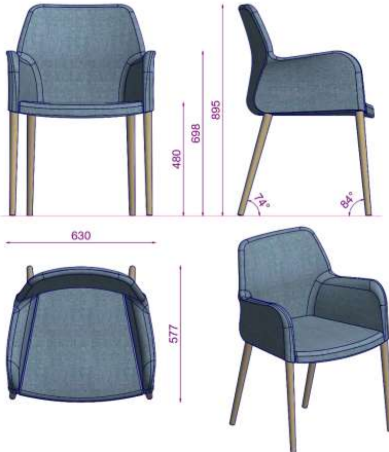
MIRANDA S2 MISAFİR S N AA 480