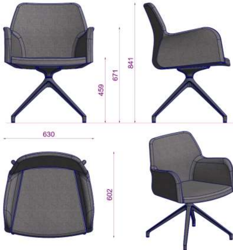
MIRANDA S2 MISAFIR S UA