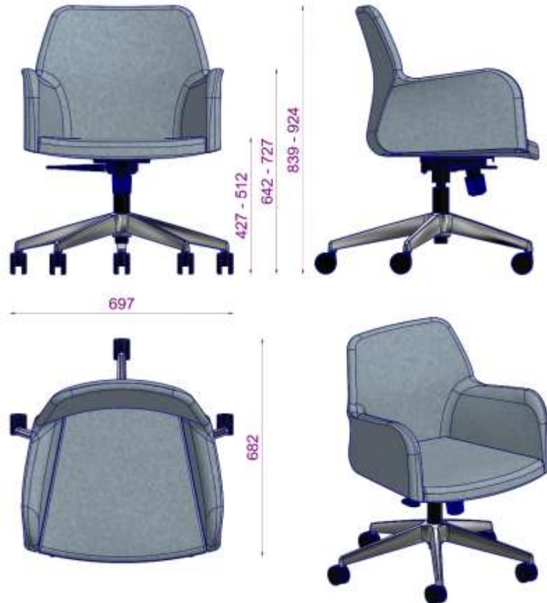
MIRANDA S2 CALISMA S KYA TM