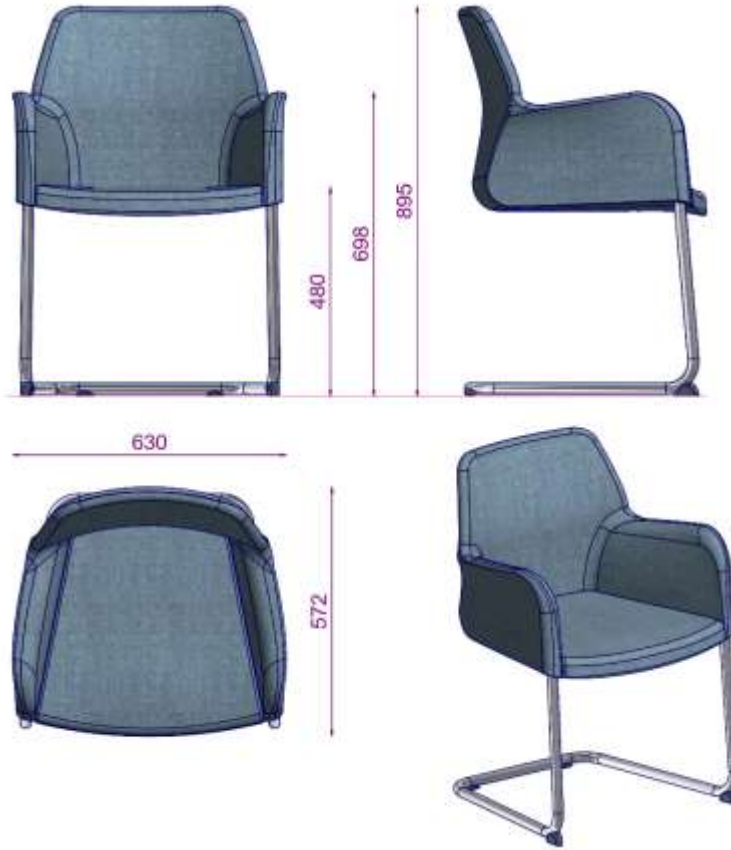
MIRANDA S2 MISAFIR S N CA