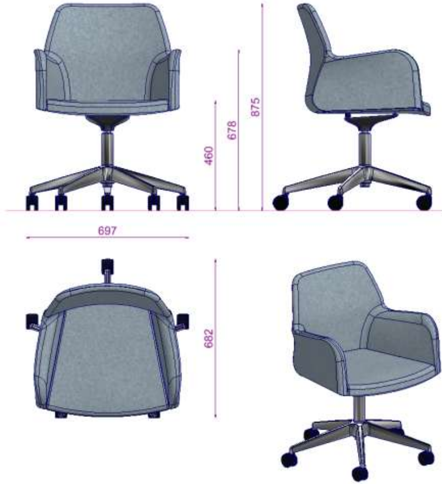
MIRANDA S2 TOPLANTI S BM