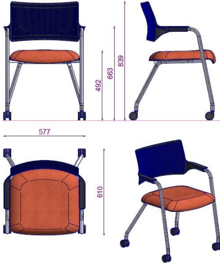
TRISTAN S6 23VY MISAFIR SANDALYESI