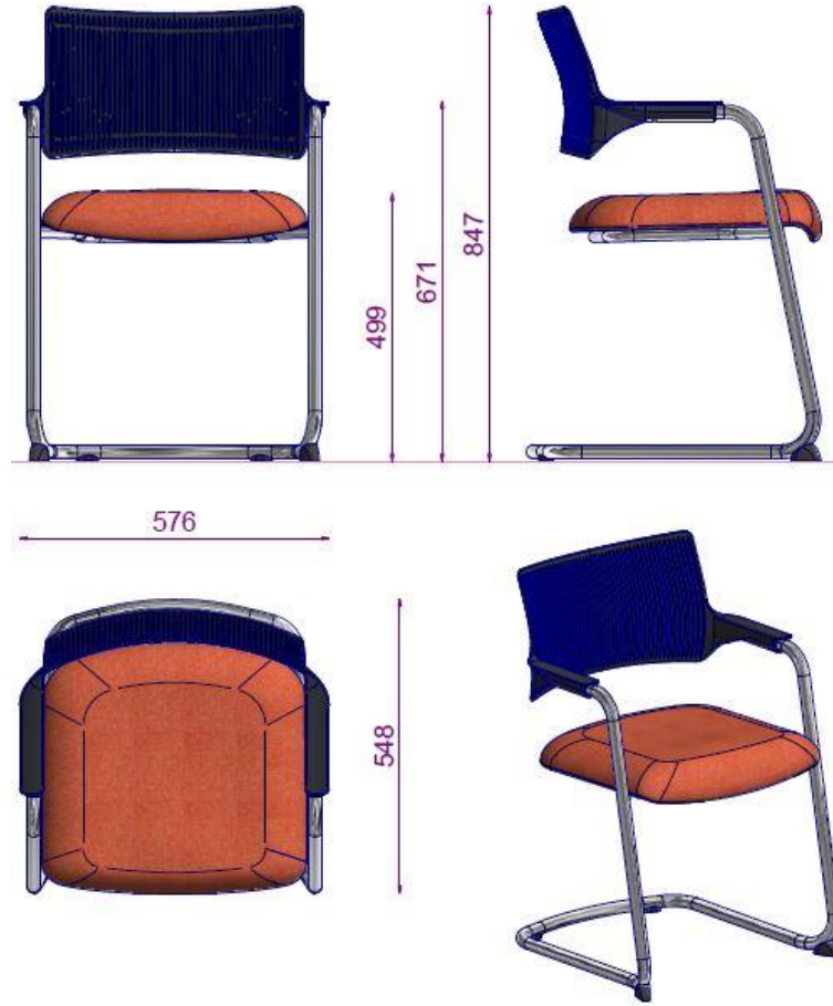
TRISTAN S6 25VY MISAFIR SANDALYESİ