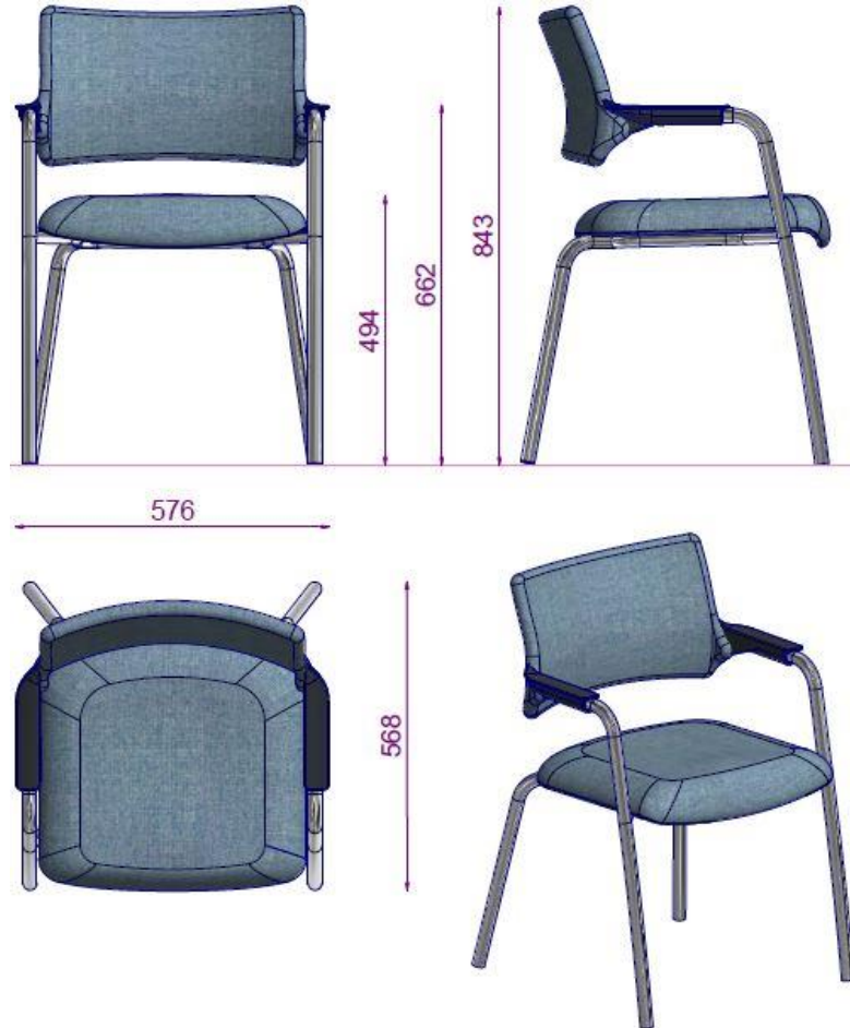
TRISTAN S6 21DS MISAFIR SANDALYESİ