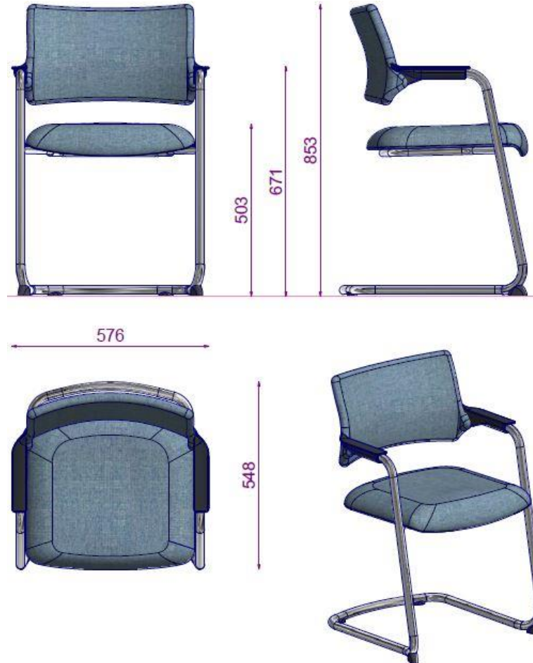
TRISTAN S6 25DS MISAFIR SANDALYESİ