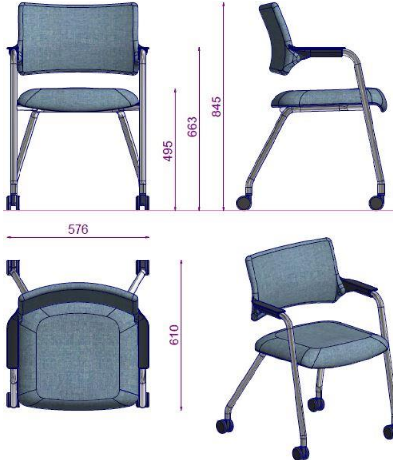
TRISTAN S6 23DS MISAFIR SANDALYESI